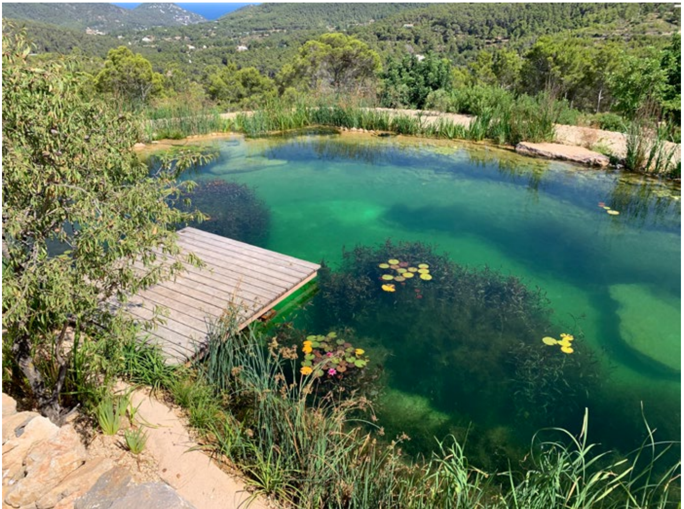
▲ Der Schwimmteich von theBiopool machte in der Kategorie »Schwimmteich Privat« das Rennen. Der Anbieter der Schwimmteiche mit Hauptsitz auf Ibiza war in Belgien vertreten, und setzte sich gegen zwei Mitbewerber durch.

tion für naturnahe Badegewässer (IOB) hat als Schirmherr des Internationalen Schwimmteichkongresses und Dachverband für weltweit tätige Schwimmteichexperten den »Pondy Award« ins Leben gerufen.